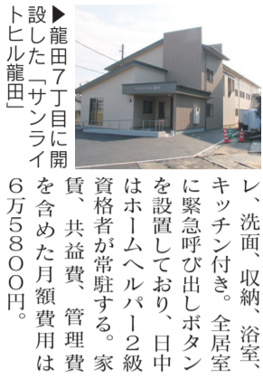
▲龍田7丁目に開設した「サンライトヒル龍田」

場所は県道熊本菊陽線沿い、龍田小学校北東側。名称は「サンライトヒル龍田」。敷地面積992㎡、木造2階建て、延べ床面積は596㎡。居室は全16室で、床面積は27㎡が15室、32㎡が1室。すべてトイレ、洗面、収納、浴室、キッチン付き。全居室に緊急呼び出しボタンを設置しており、日中はホームヘルパー2級資格者が常駐する。家賃、共益費、管理費は6万5800円。