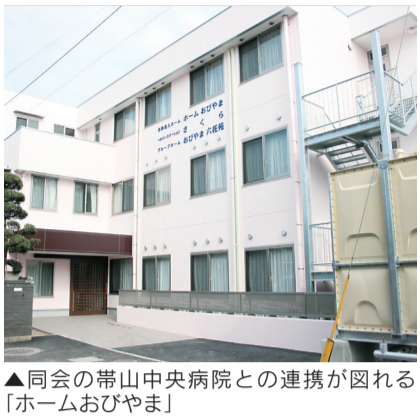
▲同会の帯山中央病院との連携が図れる「ホームおびやま」

場所はサンロード県立大通り沿い、帯山中央病院北側隣接地。敷地面積は415㎡。建物は鉄骨造り3階建てで、2、3階(延べ床面積420.79㎡)に開設。居室は2階に9室、3階に11室の計20室を開設。入居費用は月額8万5千円と9万5千円。また、1階には医療法人祐基会が開設する「グループホームおびやま六花苑」が開設。延べ床面積は216㎡。計6室の居室を設ける。入居費用は月額10万5千円。